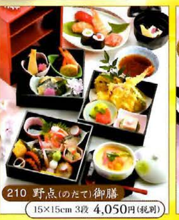
210 野点(のたて)御膳 15×15cm 3段 4,050円(税別)