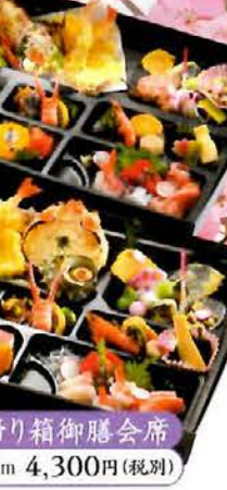
652 お持ち帰り箱御膳会席 28×38cm 4,300円(税別)