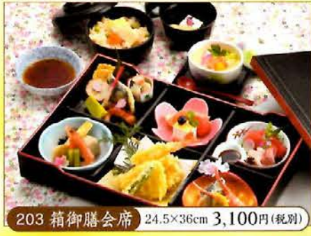
203 箱御膳会席 24.5×36cm 3,100円(税別)