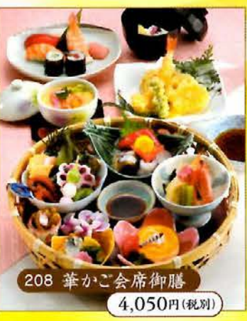
208 華かご会席御膳 4,050円(税別)