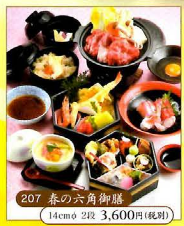
207 春の六角御膳 14cmφ 2段 3,600円(税別)