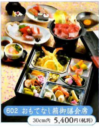
602 おもてなし箱御膳会席 30cm角 5,400円(税別)