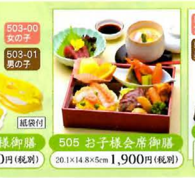
505 お子様会席御膳 20.1×14.8×5cm 1,900円(税別)