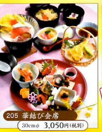
205 華結び会席 30cmφ 3,050円(税別)