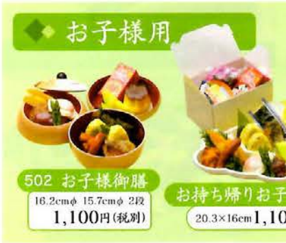
502 お子様御膳 16.2cmφ 15.7cmφ 2段 1,100円(税別)