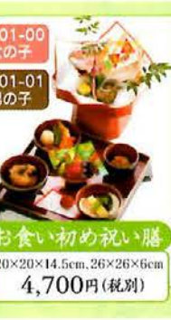
501-00 女の子 お食い初め祝い膳 20×20×14.5cm, 26×26×6cm 4,700円(税別)